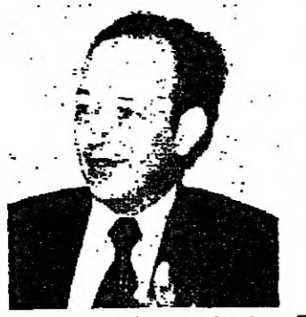
سفير الاردن السيد وليد صلاح